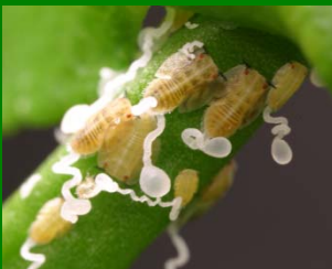
Ninfas con túbulos cerosos