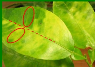
Hojas amarillentas con moteado asimétrico