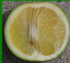
Frutos irregulares, duros, con sabor amargo y semillas oscuras