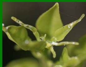
Brotos torcidos o puntas quemadas

Este psílido es un transmisor de la enfermedad Huanglongbing (“enverdecimiento de los cítricos”). Se alimenta de cítricos y plantas relacionadas.