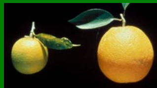
Enferma - Sana