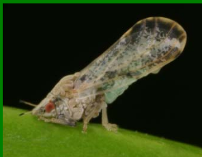
Psílido adulto 1/8 de pulgada